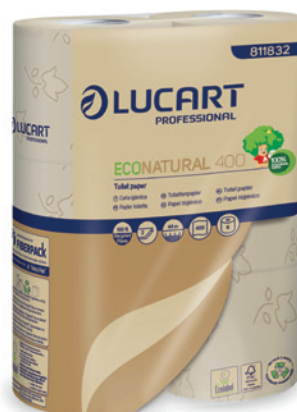
ECONATURAL toiletpapir 400, 2-lags, 30 ruller x 44 m, 9,6 x 11 cm Varenr. 30714 Normalpris 173,-