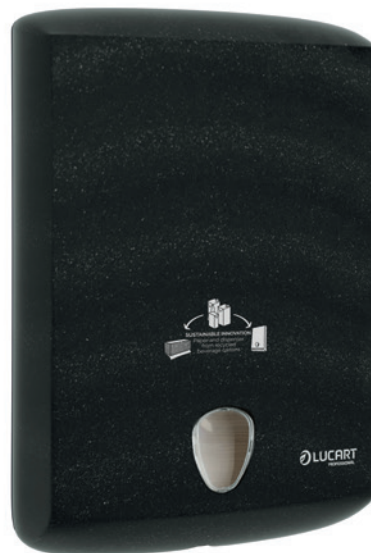
ECONATURAL Håndklædeark, dispenser, sort Varenr. 30713 Normalpris 436,-

ECONATURAL produkterne produceres af drikkekartoner. Kartonernes pap genbruges til håndklæder og toiletpapir, mens aluminium-plastdelen fra kartonernes inderside omdannes til dispensere.