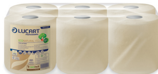
ECONATURAL Håndklæderulle 450, 2-lags, 6 ruller x 112,6 m, 20 x 25 cm Varenr. 30709 Normalpris 198,-